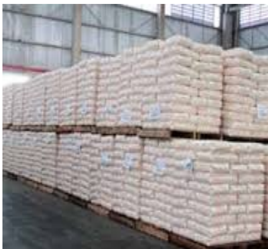
Figura 2 – armazenagem de fertilizantes embalados

11.3 Armazenagem e movimentação mista de fertilizantes: é a edificação ou área de risco construída de forma a ocupar os espaços disponíveis para armazenagem de fertilizantes a granel e embalados. Neste caso é comum a presença de estruturas, veículos e pessoas necessários às operações. Não há processos físicos de mistura e nem reações químicas intencionalmente provocadas (figura 3).