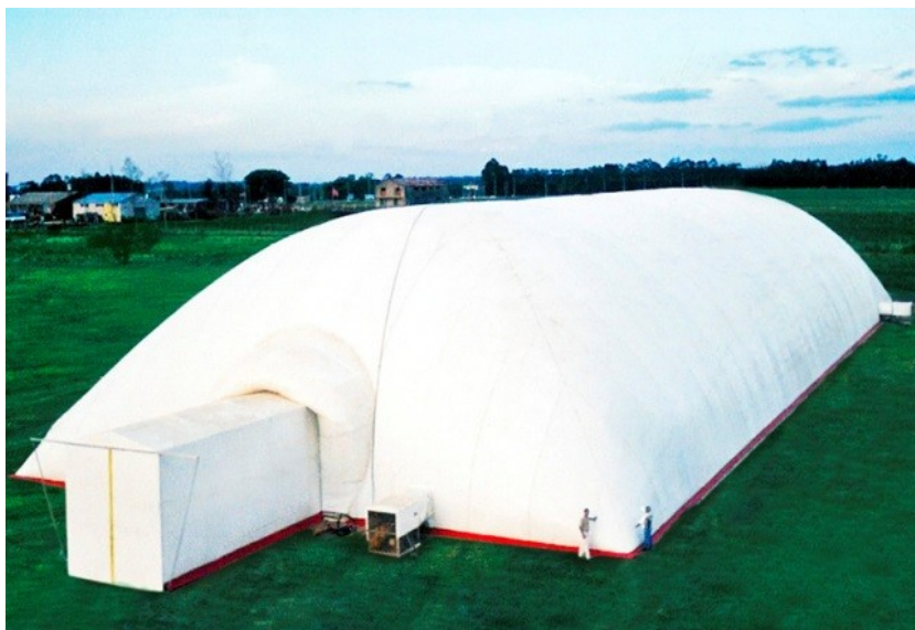
Figura 7– armazém inflável

11.8.2 É proibida a utilização de armazém inflável ou tenda autoportante para armazenagem de fertilizantes minerais de qualquer classe quando estiverem embalados e/ou em pallets, devido à carga de incêndio das embalagens e pallets .