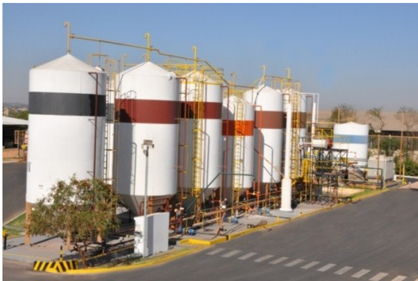
Figura 6 – armazenagem de fertilizantes líquidos

11.7 Armazenagem de fertilizantes líquidos em tancagem: área de tanques atmosféricos destinada à armazenagem de fertilizantes líquidos (figura 6).