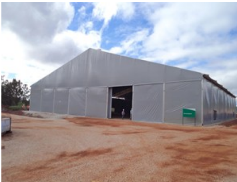
Figura 8 – tenda lonada ou autoportante