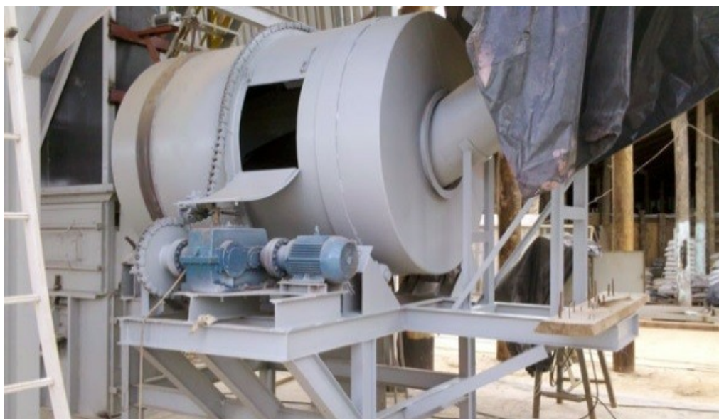
Figura 3 – misturador para fertilizantes

11.4 Produção e armazenagem de misturas de fertilizantes: Edificação ou área de risco destinada ao processamento físico de mistura, tais como a homogeneização mecânica. Os produtos (macronutrientes e micronutrientes) serão misturados para formar produtos previamente estipulados. Não há reações químicas intencionalmente provocadas, mas já há carga de incêndio relacionada a combustíveis comuns como pallets , embalagens, maquinário, etc. (figura 3).