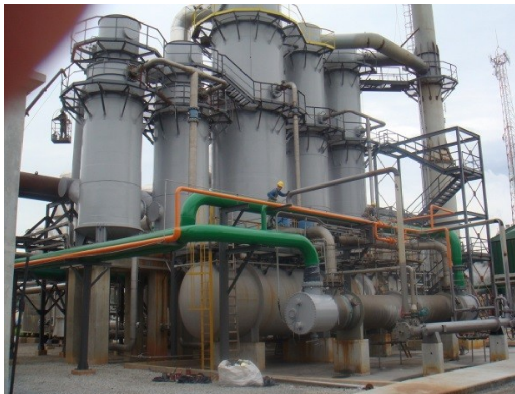
Figura 4 – fábrica de fertilizantes

11.5 Fábrica de fertilizantes: planta de processo industrial onde os nutrientes, que irão compor os fertilizantes, são produzidos a partir de reações químicas (figura 4).