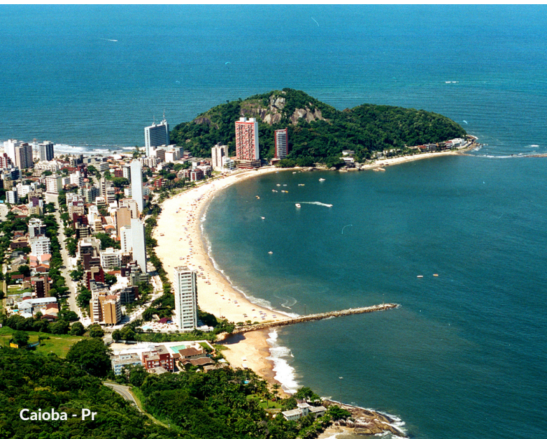
Caioaba - Pr