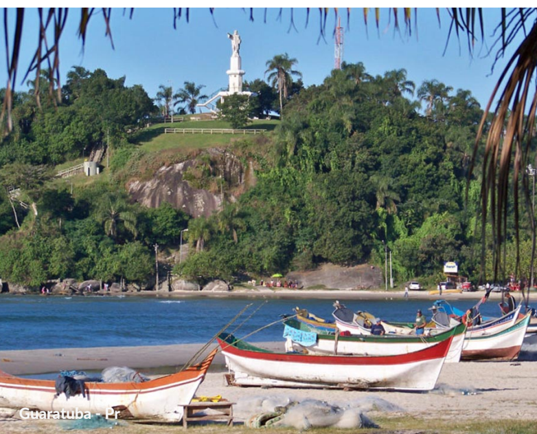
Guaratuba - Pr

O litoral do Paraná é rico em belezas naturais e possui atrações para os diferentes gostos e idades, em todas as estações do ano. As cidades oferecem muitas opções de lazer e diversão, culinária típica, esportes, pescaria, além de belas paisagens e lindas praias. Por lá, você também vai poder praticar esportes, velejar, pescar e se deliciar com sabores típicos e inesquecíveis. Tudo em meio a paisagens que são um verdadeiro espetáculo para os olhos, deslumbram e trazem paz ao coração. As praias além de lindas são limpas e possuem toda a infra-estrutura para proporcionar o conforto e a tranquilidade que você merece.